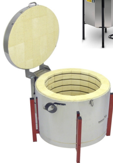
SL 120 SL 190 SL 300